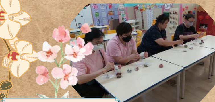
一起製作保健養生茶包

本園邀請了全仁中醫註冊中醫師到校為家長舉辦中醫養生講座。活動讓家長認識兒童及成人保健湯水、食療及中醫養生，並製作養生茶包。