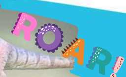
哪一位小朋友扮得像恐龍？