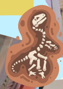
幼兒認識不同的恐龍化石。