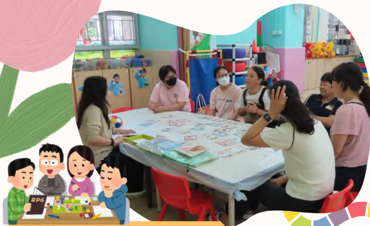
透過小遊戲，放鬆心情！

為讓家長減輕生活的壓力，本園特意邀請家福會註冊社工到校為一眾家長進行多元藝術活動。讓家長透過頌鉢療法、藝術活動等，幫助家長學習辨識及正面表達情緒。